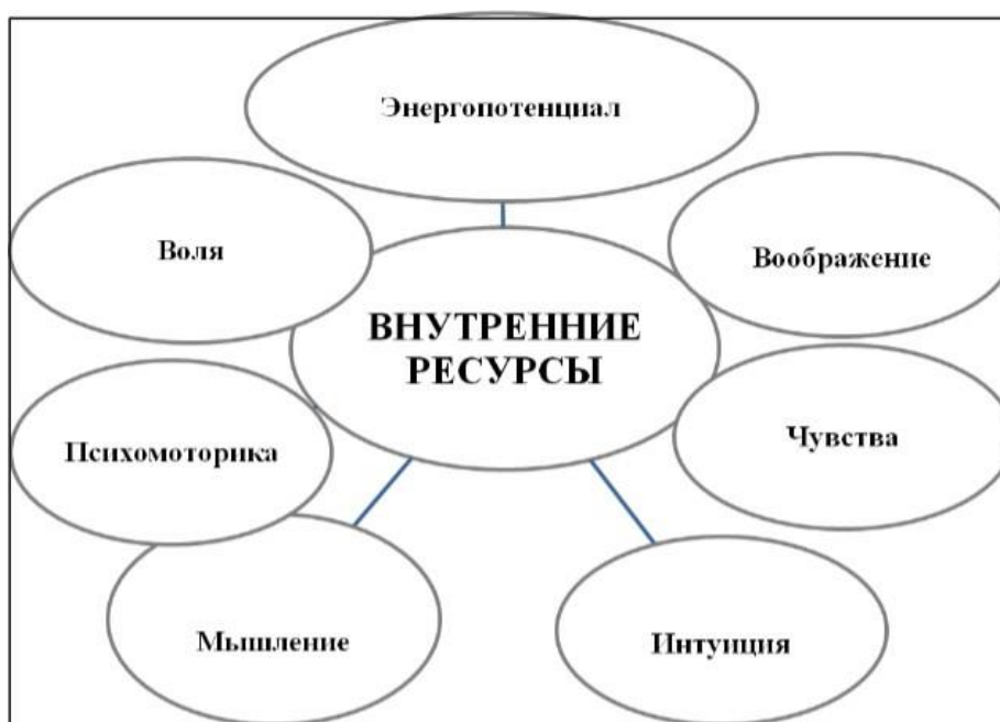
Рисунок 1. Структура внутренних ресурсов человека

Изобразите на отдельном листе бумаги каждый ресурсный компонент, можно в виде образа, предмета, явления и т.п. Подумайте, с какими жизненными трудностями этот ресурс вам помог справиться, обозначьте их на соответствующем данному ресурсу листе. На выполнение задания отводится 15 мин. Приступайте.